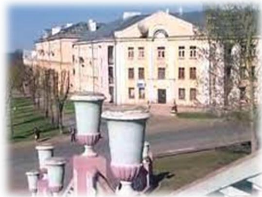
Näkymä Kohtla-Järvestä ja Sillanmäestä

klo 19.00 Rakvere, lyhyt kaupunkikiertros ja illallinen, ravintola Villa Theresa, omakustanteinen