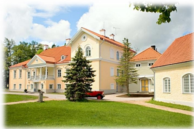
Kuva Vihulan kartanosta

Kartanot, ”kolme sisarusta”, sijaitsevat Lahemaan kansallispuiston alueella muutamien kilometrien päässä toisistaan. Palmse, johon majoitumme, on alueen ensimmäinen täysin kunnostettu kartanokokonaisuus puistoineen, puutarhoineen ja historiallisine rakennuksineen. Sagadi puolestaan on parhaiten säilyttänyt 1700-luvulta olevan ilmeensä. Vihulan kartanon nykyinen kivistä tehty päärakennus on pystytetty tulipalossa tuhoutuneen tilalle ja muut kartanoon kuuluvat rakennukset on kunnostettu viime vuosien aikana.