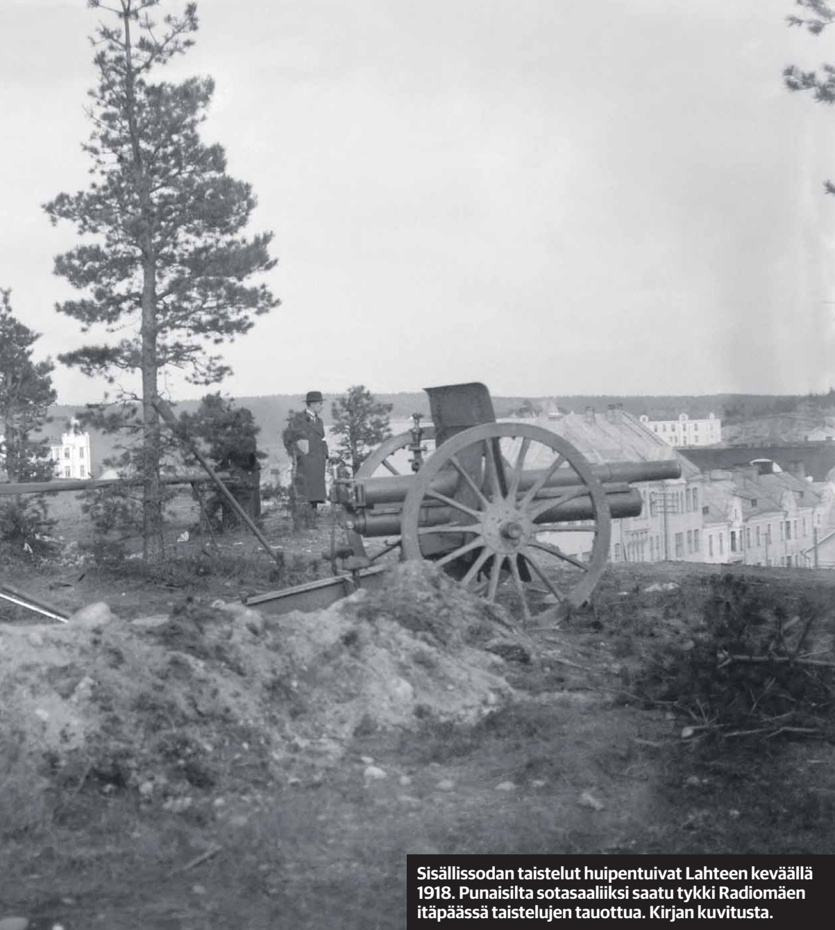
Sisällissodan taistelut huipentuivat Lahteen keväällä 1918. Punaisilta sotasaaliiksi saatu tykki Radiomäen itäpäässä taistelujen tauottua. Kirjan kuvitusta.