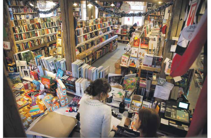
Kirjamyyntiä Sysmän kirjakaupassa viime perjantaina.